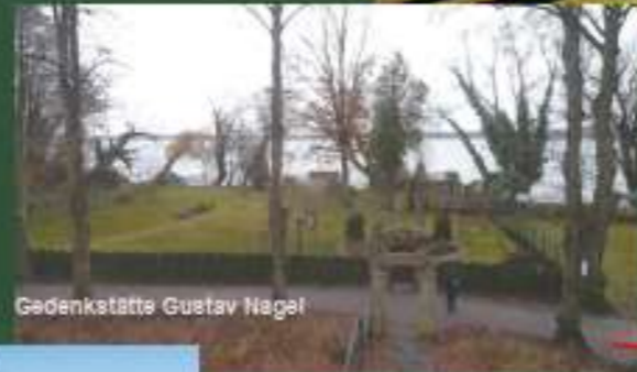
Gedenkstätte Gustav Nagel