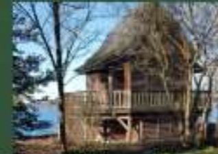
Bootshaus / privat